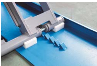
Seguro neumático de plataforma Pneumatic platform lock