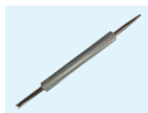
US-1030 Llave obuses Valve wheels key