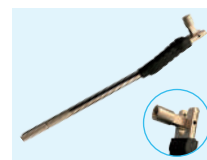
JAR-211 Palanca montar válvulas turismo con protección Lever with protection to mount tourism valves