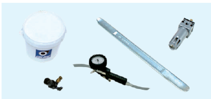
Accesorios en dotación – Standard accessories

Automatic tyre changer suitable for car and motorcycle wheels having. Tilting vertical arm, operating arm pneumatic locking, air operated bead-breaker, extractable pedal unit. This "GT" system is provided with a boiler air compressed which contains 18 L air and some pass ducts from boiler to claws where the air flows. This system is a big help because when the 18 L of air are drained at once between tire and rim, it's easier to adhere the stub during the assembling.