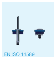
EN ISO 14589