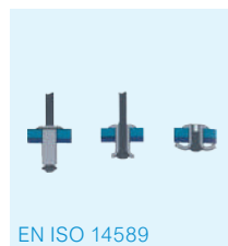
EN ISO 14589