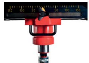
Cabezal desplazable Moveable head