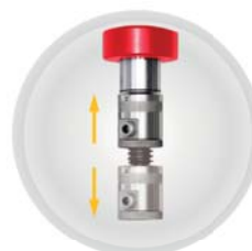
Extensión enroscable Screw extension