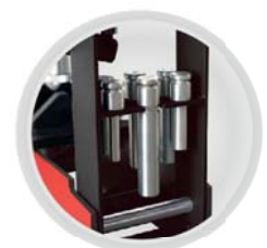
Juego de punzones accesorios estándar Punches sets are Standard accessories