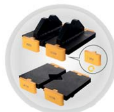
Bloques en V y diseño de guía de 180° V-blocks & 180° guiding desing