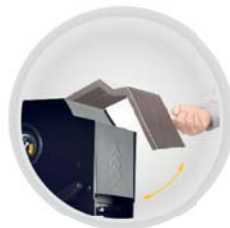
Cubierta protector polvo Dustproof cover