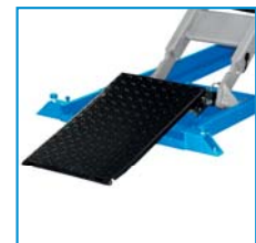
Rampa de acceso Entrance ramp