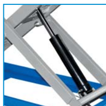
Pistón hidráulico Hydraulic piston