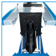
Plataforma delantera abatible Removable front plate