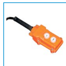
Mando accionador manual Hand-held remote control