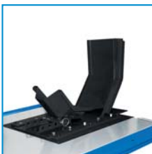
Mordaza delantera desmontable Removable front wheel chock