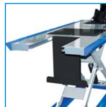
Plataforma trasera abatible Removable back plate