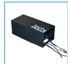
Central hidráulica Power unit