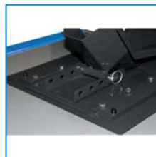
Diferentes posiciones mordaza delantera Different front caliper positions