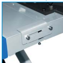
Bloqueo plataforma delantera Front platform lock