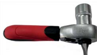
Carraca con porta-puntas Ratchet with bits holder

Carraca de dimensiones reducidas para trabajos en espacios reducidos